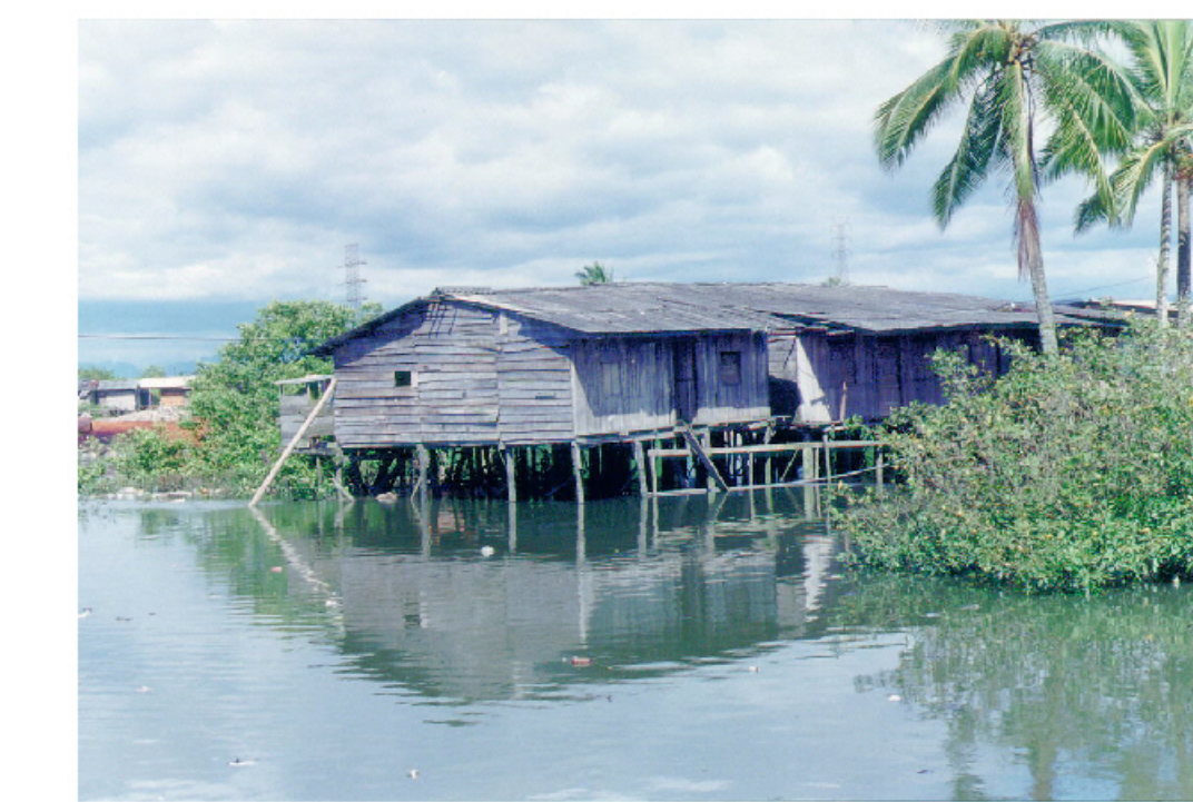
Vivienda típica en zona de bajamar