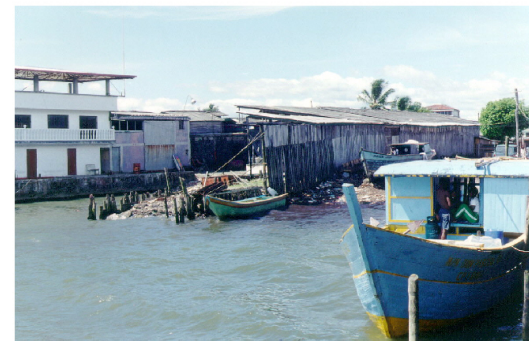
Mestizaje de materiales