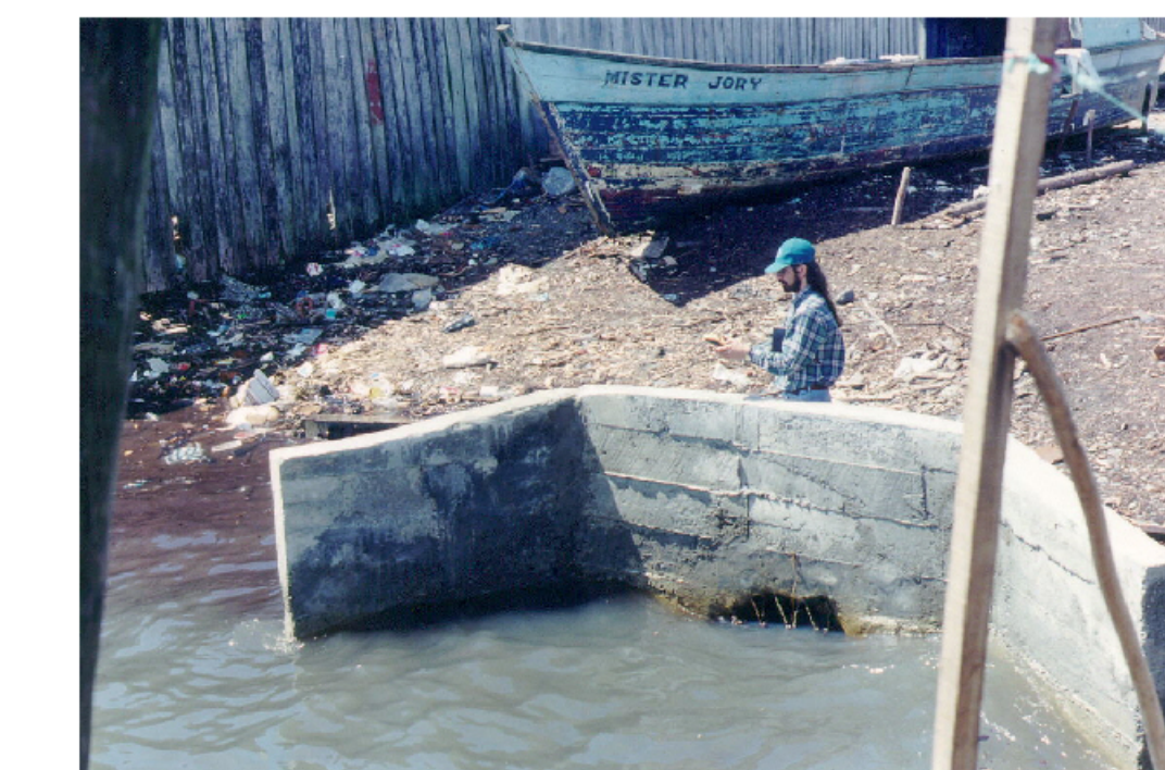
Entrega de un colector en bajamar; calle en relleno mixto