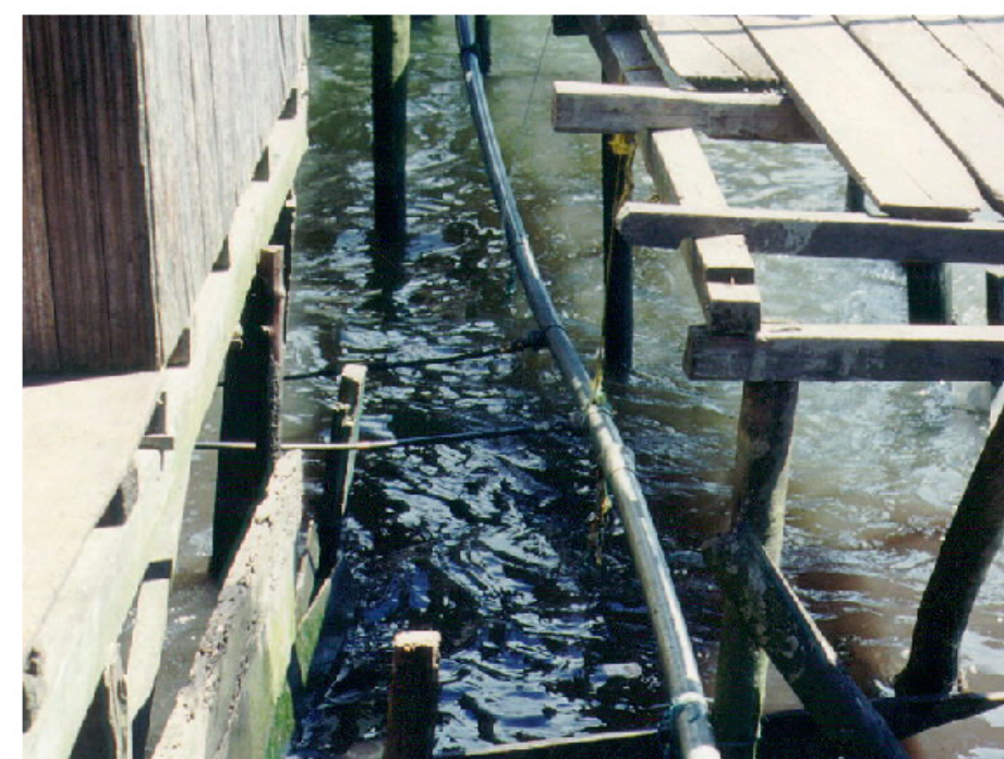
Puentes y acueducto en zonas de bajamar