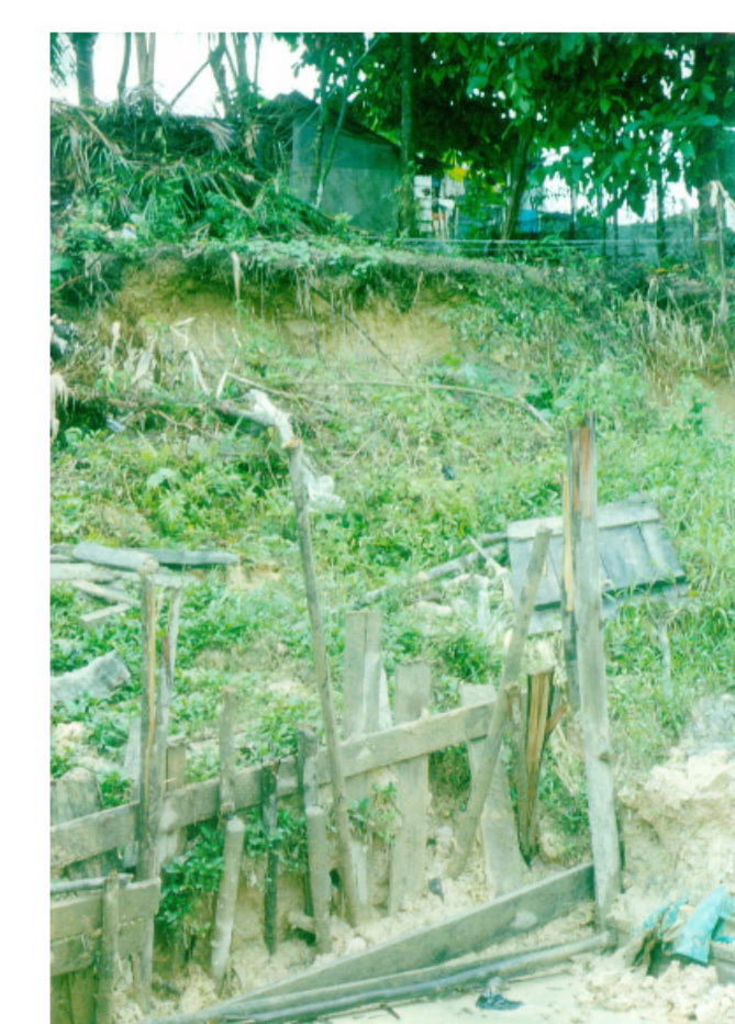
Problemas de erosión por agua