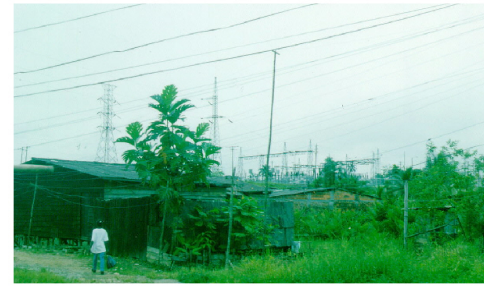
Línea de alta tensión