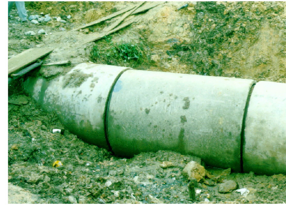
Construcción de alcantarillado en vía interna