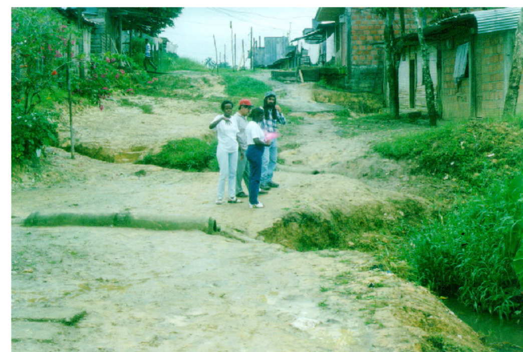
Erosión por falta de infraestructura adecuada para manejo de aguas lluvias