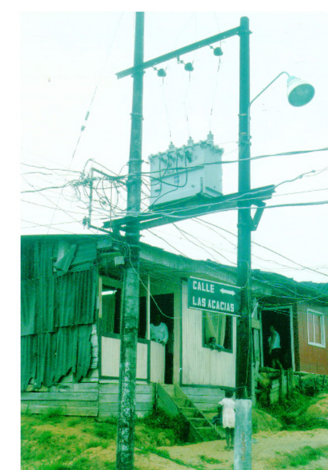
Redes eléctricas peligrosas