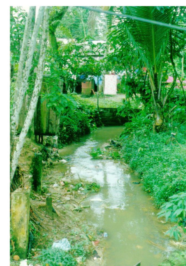
Quebrada convertida en caño de aguas servidas