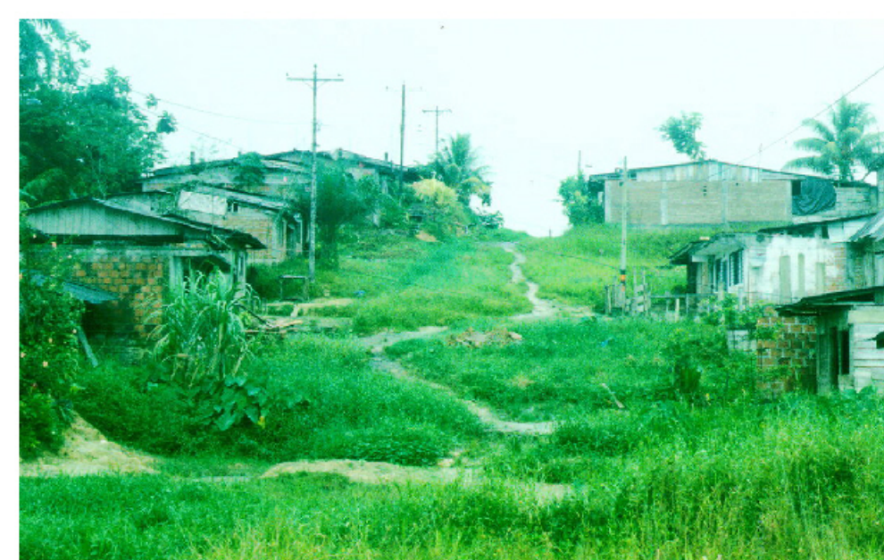
Asentamiento en zona de ladera, mal o ningún manejo de aguas